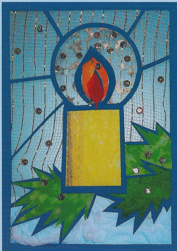
Витраж «Горящая свеча». Автор Н. В. Дубровская

Еще необходима гофрированная бумага белого, зеленого, красного, оранжевого цветов, а также золотые пайетки.